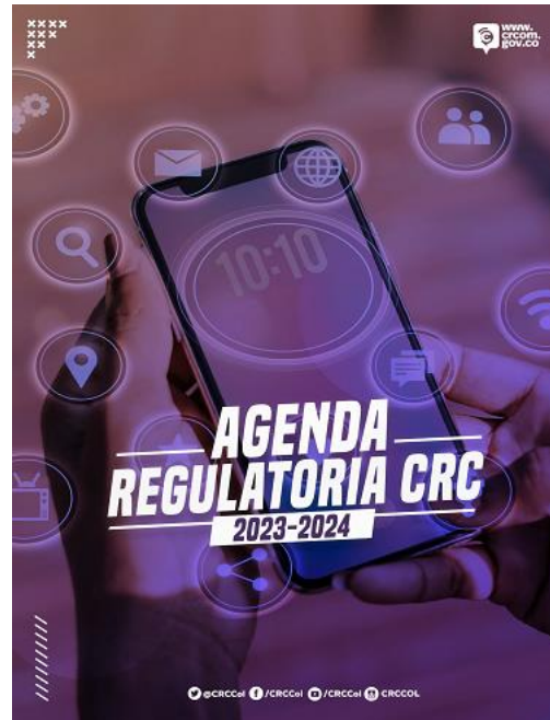
Ilustración 3. Agenda Regulatoria CRC 2023-2024

En línea con la política de mejora regulatoria de la Comisión, la Agenda Regulatoria CRC 2024-2025 es el punto de partida dentro del ciclo regulatorio, que responde a criterios de transparencia y objetividad en la identificación de tendencias, análisis de disponibilidad de recursos y priorización de actividades e interacción permanente con los grupos de valor. Así, su construcción se realiza a partir de: