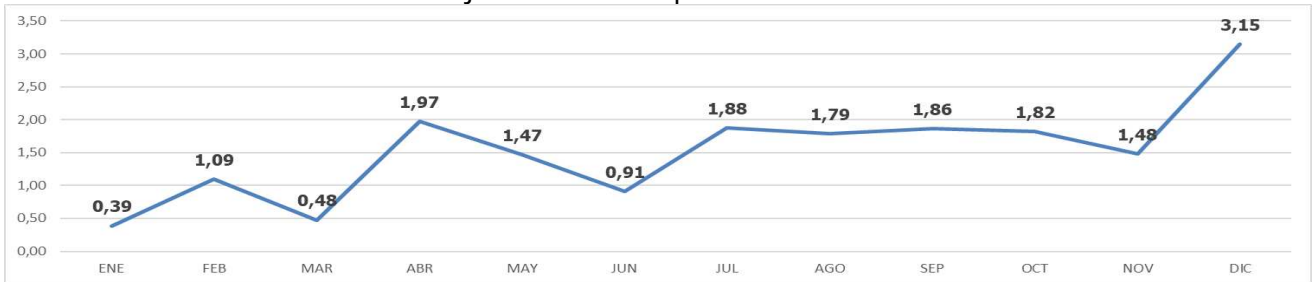
Gráfica 01. Porcentaje de ausentismo por causas médicas CRC 2023

En la siguiente tabla se presenta en consolidado del número de casos de ausentismo agrupados por trimestre, donde el mayor número de casos se encuentra relacionado con el sistema respiratorio.