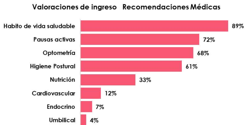
Grafica 03. Recomendaciones médicas emitidas en los exámenes periódicos CRC 2023