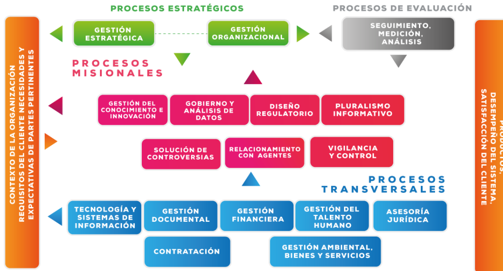
Ilustración 2. Mapa de procesos de la CRC