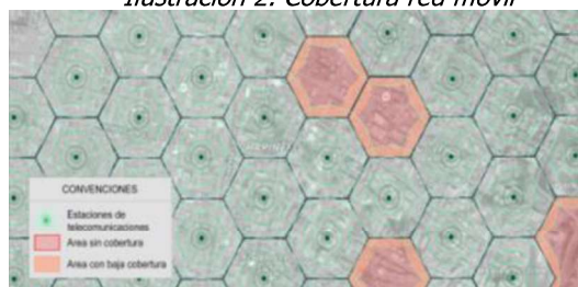
Ilustración 2. Cobertura red móvil

Los servicios de voz y datos ofrecidos por los operadores móviles en Colombia tanto para tecnologías 3G UMTS y 4G LTE, técnicamente implican que el rango efectivo de funcionamiento de cada estación es reducido, lo que implica una limitada cobertura a usuarios, haciendo que las limitaciones para la localización de antenas tengan la potencialidad de impedir la ubicación de infraestructura de telecomunicaciones requerida en el municipio. Una restricción de despliegue de nueva infraestructura de telecomunicaciones tiene como consecuencia sectores poblados sin cobertura alguna de servicios de telecomunicaciones, o con condiciones deficientes de calidad y cobertura que afectarán a los usuarios actuales y potenciales de dichos servicios, tal como se presenta en la Ilustración 2.