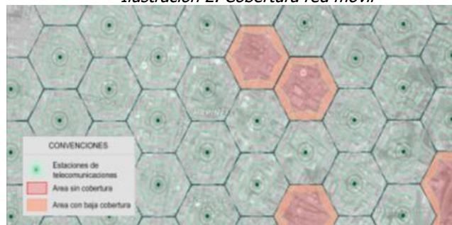
Ilustración 2. Cobertura red móvil

Los servicios de voz y datos ofrecidos por los operadores móviles en Colombia tanto para tecnologías 3G UMTS y 4G LTE, técnicamente implican que el rango efectivo de funcionamiento de cada estación es reducido, lo que implica una limitada cobertura a usuarios, haciendo que la exigencia de requisitos adicionales tenga la potencialidad de impedir la ubicación de infraestructura de telecomunicaciones requerida en el municipio. La restricción de despliegue de infraestructura de telecomunicaciones tiene como consecuencia sectores poblados o de concurrencia de población sin cobertura alguna de servicios de telecomunicaciones, o con condiciones deficientes de calidad y cobertura que afectarán a los usuarios actuales y potenciales de dichos servicios, tal como se presenta en la Ilustración 2. Cobertura móvil.