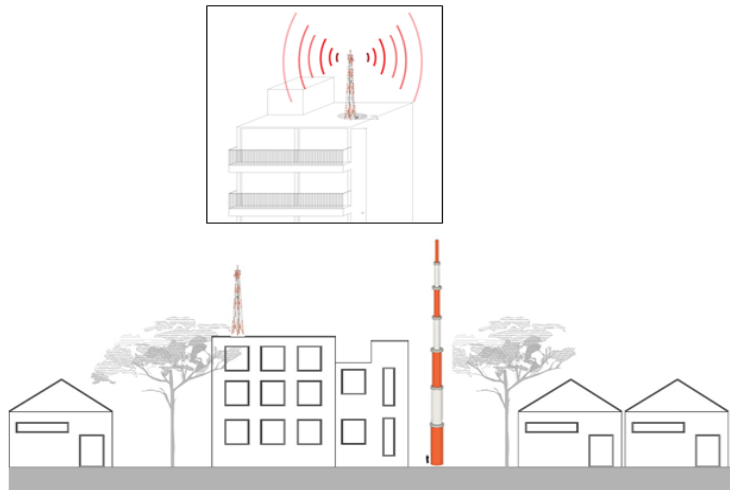
Ilustración 3. Estructura en azotea y torre auto soportada

Ahora bien, el área de servicio depende de la ubicación de la antena y de la altura de esta respecto a las edificaciones circunvecinas, es por esto por lo que las antenas de telecomunicaciones se instalan en infraestructura soporte como torres o mástiles o en ubicaciones altas (azoteas, terrazas) donde se supere la altura de las edificaciones aledañas. En la Ilustración 3, se puede observar cómo estructuras de soporte (para el ejemplo que nos ocupa una estructura en azotea y una torre auto soportada) de comunicaciones inalámbricas, requieren una mayor altura que las edificaciones circunvecinas para poder asegurar la prestación eficiente de los servicios que son ofrecidos a través de las antenas que se instalan en dicha infraestructura.