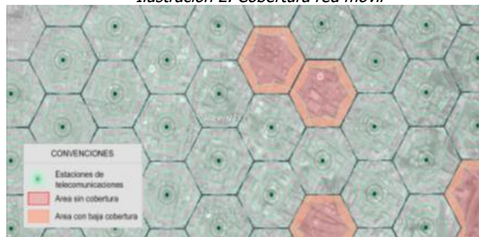
Ilustración 2. Cobertura red móvil

Los servicios de voz y datos ofrecidos por los operadores móviles en Colombia tanto para tecnologías 3G UMTS y 4G LTE, técnicamente implican que el rango efectivo de funcionamiento de cada estación es reducido, lo que implica una limitada cobertura a usuarios, haciendo improcedente la prohibición de ubicación en diferentes zonas en inmuebles del municipio. La restricción de despliegue de infraestructura de telecomunicaciones tiene como consecuencia sectores poblados sin cobertura alguna de servicios de telecomunicaciones, o con condiciones deficientes de calidad y cobertura que afectarán a los usuarios actuales y potenciales de dichos servicios, tal como se presenta en la Ilustración 2. Cobertura móvil.