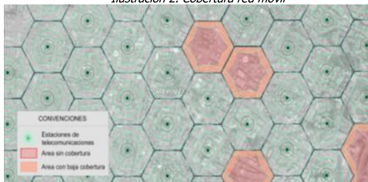
Ilustración 2. Cobertura red móvil

Los servicios de voz y datos ofrecidos por los operadores móviles en Colombia tanto para tecnologías 3G UMTS y 4G LTE, técnicamente implican que el rango efectivo de funcionamiento de cada estación es reducido, lo que implica una limitada cobertura a usuarios, haciendo improcedente la prohibición de ubicación en diferentes zonas en inmuebles del municipio. La restricción de despliegue de infraestructura de telecomunicaciones tiene como consecuencia sectores poblados sin cobertura alguna de servicios de telecomunicaciones, o con condiciones deficientes de calidad y cobertura que afectarán a los usuarios actuales y potenciales de dichos servicios, tal como se presenta en la Ilustración 2. Cobertura móvil.