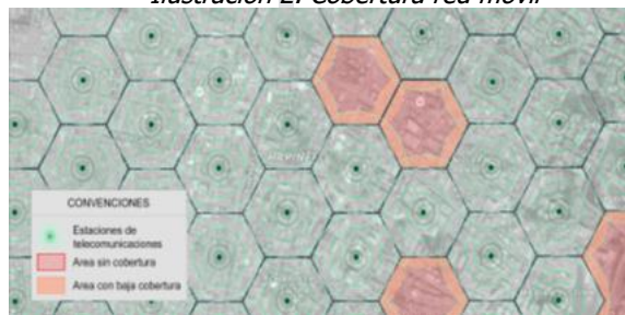
Ilustración 2. Cobertura red móvil

Los servicios de voz y datos ofrecidos por los operadores móviles en Colombia tanto para tecnologías 3G UMTS y 4G LTE, técnicamente implican que el rango efectivo de funcionamiento de cada estación es reducido, lo que representa una limitada cobertura a usuarios. Lo anterior, hace que la exigencia de requisitos adicionales y la prohibición de la instalación de antenas en algunas zonas representen restricciones al despliegue de infraestructura de telecomunicaciones y generen como consecuencia sectores poblados sin cobertura alguna de servicios de telecomunicaciones, o con condiciones deficientes de calidad y cobertura que afectarán a los usuarios actuales y potenciales de dichos servicios, tal como se presenta en la Ilustración 2.