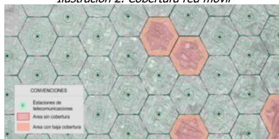
Ilustración 2. Cobertura red móvil

Los servicios de voz y datos ofrecidos por los operadores móviles en Colombia tanto para tecnologías 3G UMTS y 4G LTE, técnicamente implican que el rango efectivo de funcionamiento de cada estación es reducido, lo que representa una limitada cobertura a usuarios. Lo anterior, hace que la exigencia de requisitos adicionales y la prohibición de la instalación de antenas en algunas zonas representen restricciones al despliegue de infraestructura de telecomunicaciones y generen como consecuencia sectores poblados sin cobertura alguna de servicios de telecomunicaciones, o con condiciones deficientes de calidad y cobertura que afectarán a los usuarios actuales y potenciales de dichos servicios, tal como se presenta en la Ilustración 2.