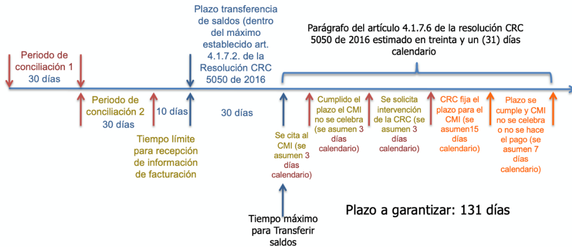
Ilustración 1. Esquema de línea de tiempo

En este sentido, UNIMOS deberá precisar en su OBI que el plazo a garantizar corresponde máximo a ciento treinta y un (131) días calendario y no a ciento treinta y cuatro (134) como había indicado.