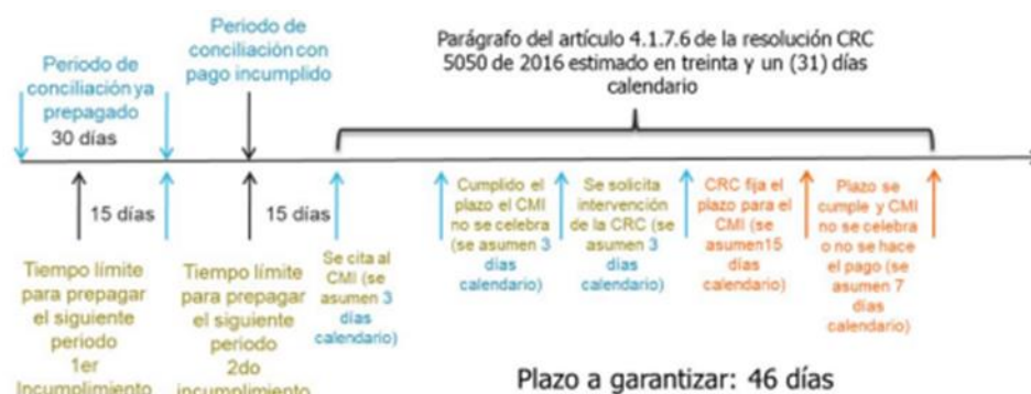
Ilustración 1. Esquema de línea de tiempo

Dicho período es el resultado del siguiente cálculo: (i) el período de conciliación (30 días calendario) menos el número de días de anticipación con que se paga el mes siguiente objeto de pago anticipado (15 días calendario), más (ii) el tiempo previsto en el procedimiento para asegurar la celebración del CMI de que trata el parágrafo del artículo 4.1.7.6 de la Resolución CRC 5050 de 2016, estimado en treinta y un (31) días calendario. En aras de dar claridad al anterior cálculo, el término a garantizar cuando se prepagen o se pague anticipadamente la obligación, se muestra en la línea de tiempo expuesta en la Ilustración 1: