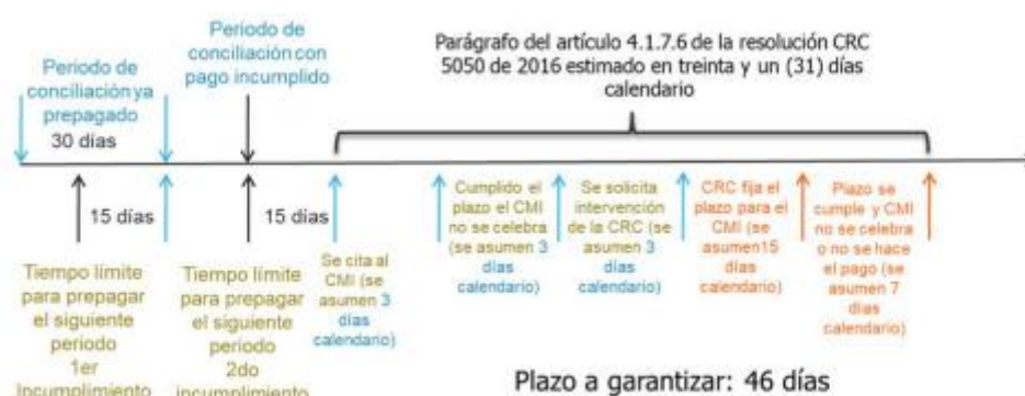
Ilustración 2. Esquema de línea de tiempo

Dicho período es el resultado del siguiente cálculo: (i) el período de conciliación (30 días calendario) menos el número de días de anticipación con que se paga el mes siguiente objeto de pago anticipado (15 días calendario), más (ii) el tiempo previsto en el procedimiento para asegurar la celebración del CMI de que trata el parágrafo del artículo 4.1.7.6 de la Resolución CRC 5050 de 2015, estimado en treinta y un (31) días calendario. En aras de dar claridad al anterior cálculo, el término a garantizar cuando se prepagan o se pague anticipadamente la obligación, se muestra en la línea de tiempo expuesta en la Ilustración 2: