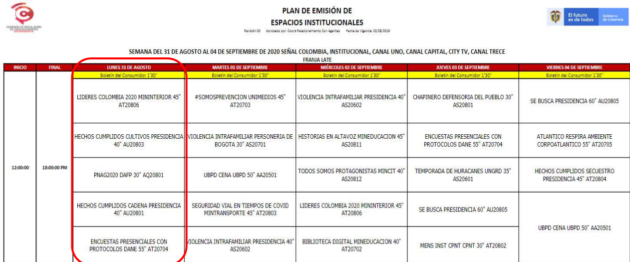
Imagen 1. Plan de Emisión de Espacios Institucionales – Franja Late

En este sentido, al revisar el Plan de Emisión de Espacios Institucionales elaborado por la CRC para la semana del 31 de agosto de 2020 al 4 de septiembre de 2020, e informado a los canales mediante correo electrónico 1 , se encontró que se establecieron los siguientes mensajes para ser transmitidos en el espacio institucional de la franja late: