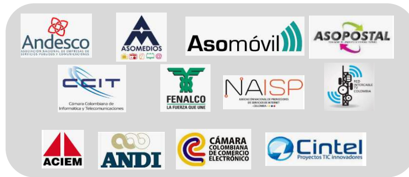
Ilustración 3. Gremios participantes en las actividades de socialización del sandbox

Durante la etapa previa al inicio de la convocatoria, se socializó el sandbox regulatorio con los principales gremios del sector como principales interesados en el mecanismo: