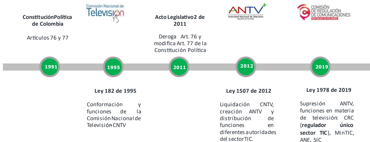
Ilustración 2. Línea de tiempo- marco legal competencial.