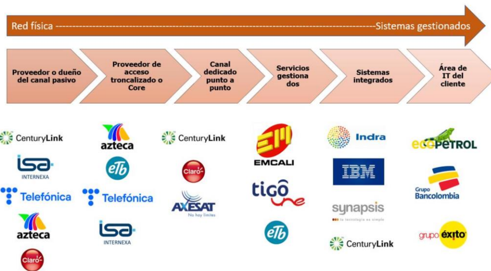
Ilustración 29. Cadena de valor del servicio portador

Operadores y agentes de la cadena de valor mercado mayorista portador