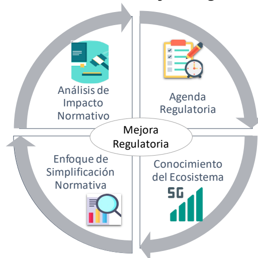
Gráfico 2. Pilares de Mejora Regulatoria